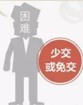
交纳党费确有困难的党员