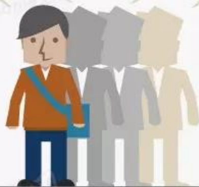
学生党员、下岗失业的党员、依靠抚恤或救济生活的党员、领取当地最低生活保障金的党员